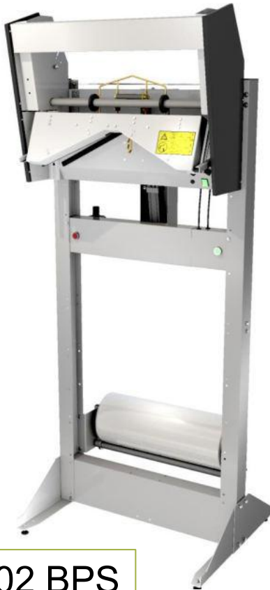
H 602 BPS