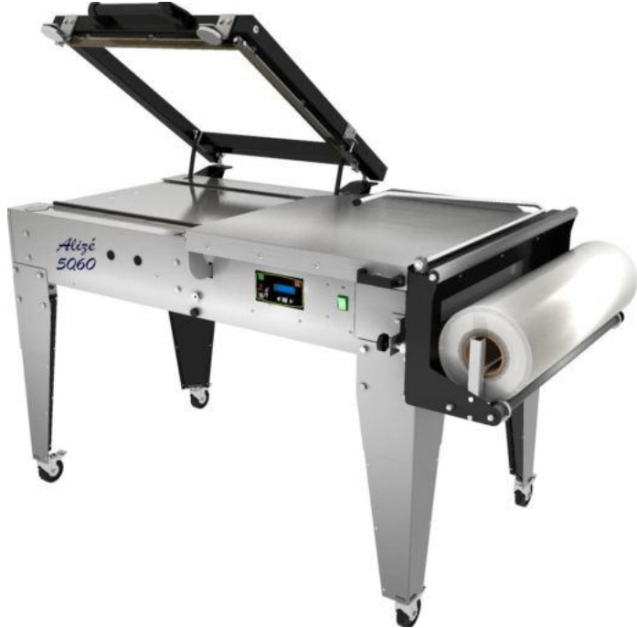
Alizé 5060 V3